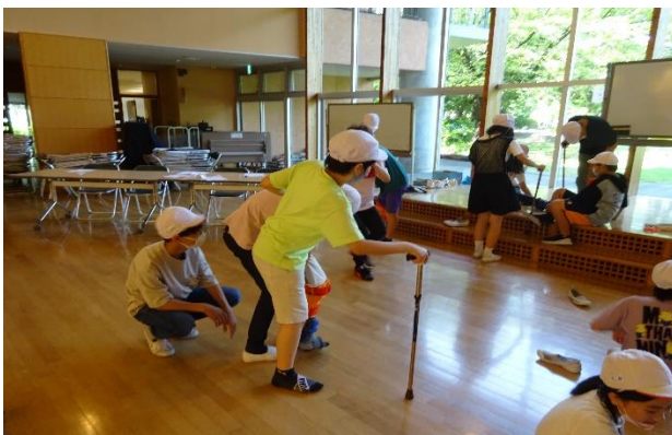
歩くのも一苦労・・・