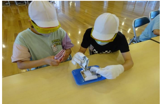
手先がうまく使えなくなってしまうようです